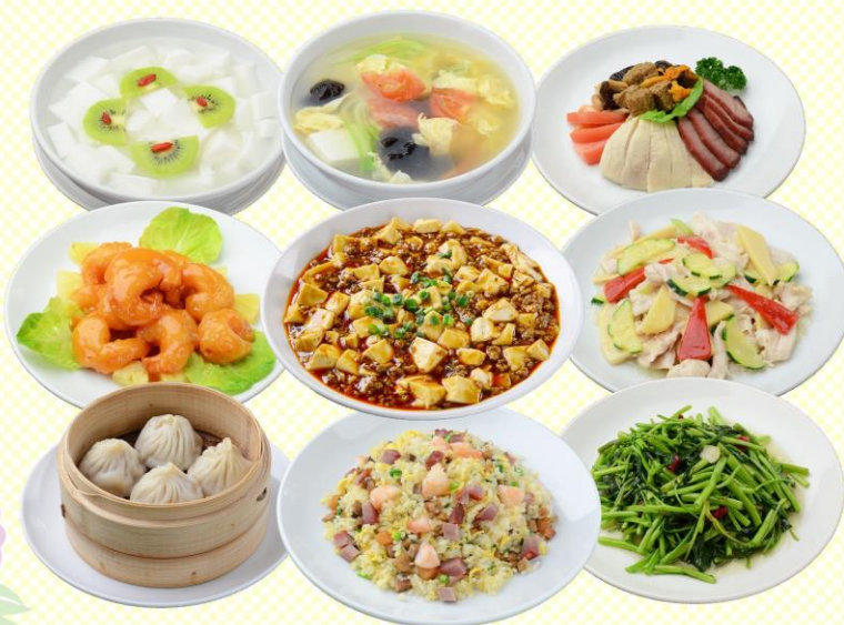
写真は4名様分のイメージです