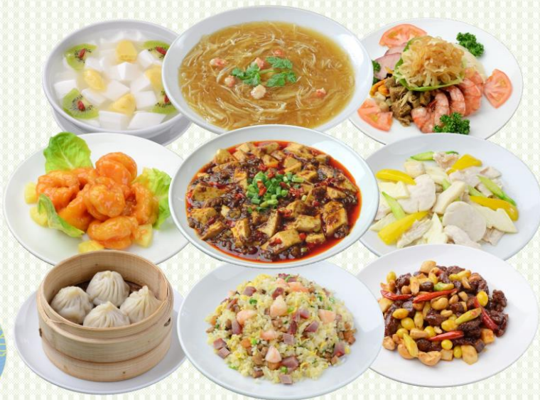
写真は4名様分のイメージです